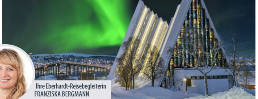
Eismeerkathedrale in Tromsø