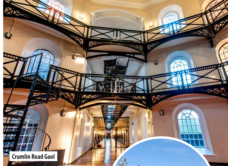
Crumlin Road Gaol