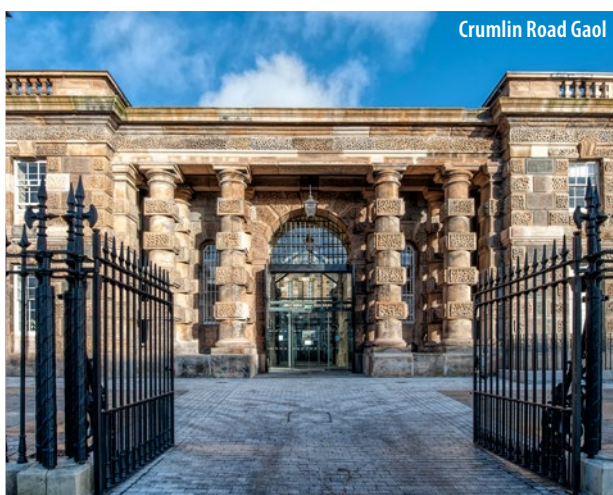
Crumlin Road Gaol