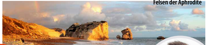
Felsen der Aphrodite