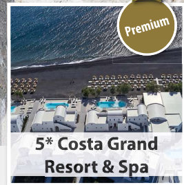
5* Costa Grand Resort & Spa