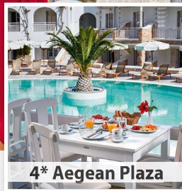
4* Aegean Plaza